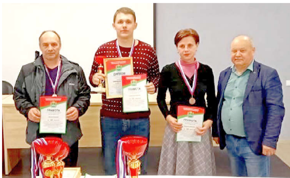
В командном зачете наши шахматисты заняли третье место.